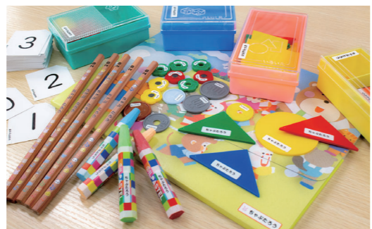
写真の文具類はプレゼントに含まれません。

受付期間: 2022年12月12日～2023年4月30日まで 受付時間: 平日10:00～17:00 土日祝日 年末年始休み 連絡先: 0800-805-1176 (江戸製版印刷株式会社)